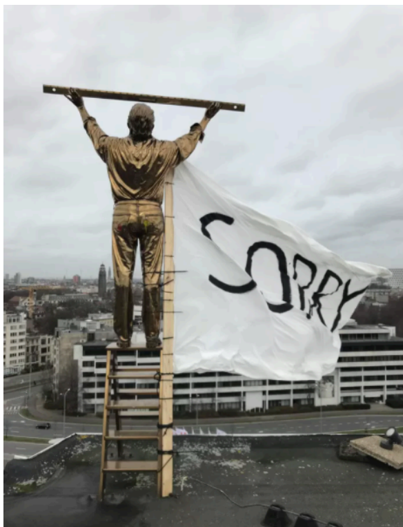
Bron: "Studenten Hangen Vlag Met 'Sorry' Aan Beeld Van Jan

Dat zijn dingen dat ik denk... Allez. Als kunstschool, als kunstinstituut, als deSingel een statement moet maken, dan haal je dat er af. 96