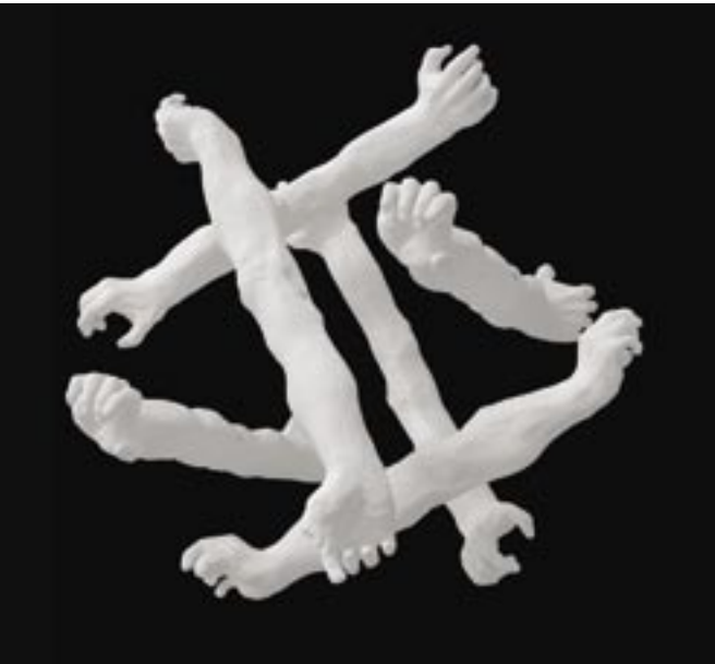
Suspended Animation / Skendöd, 2020 Korsning, 2020