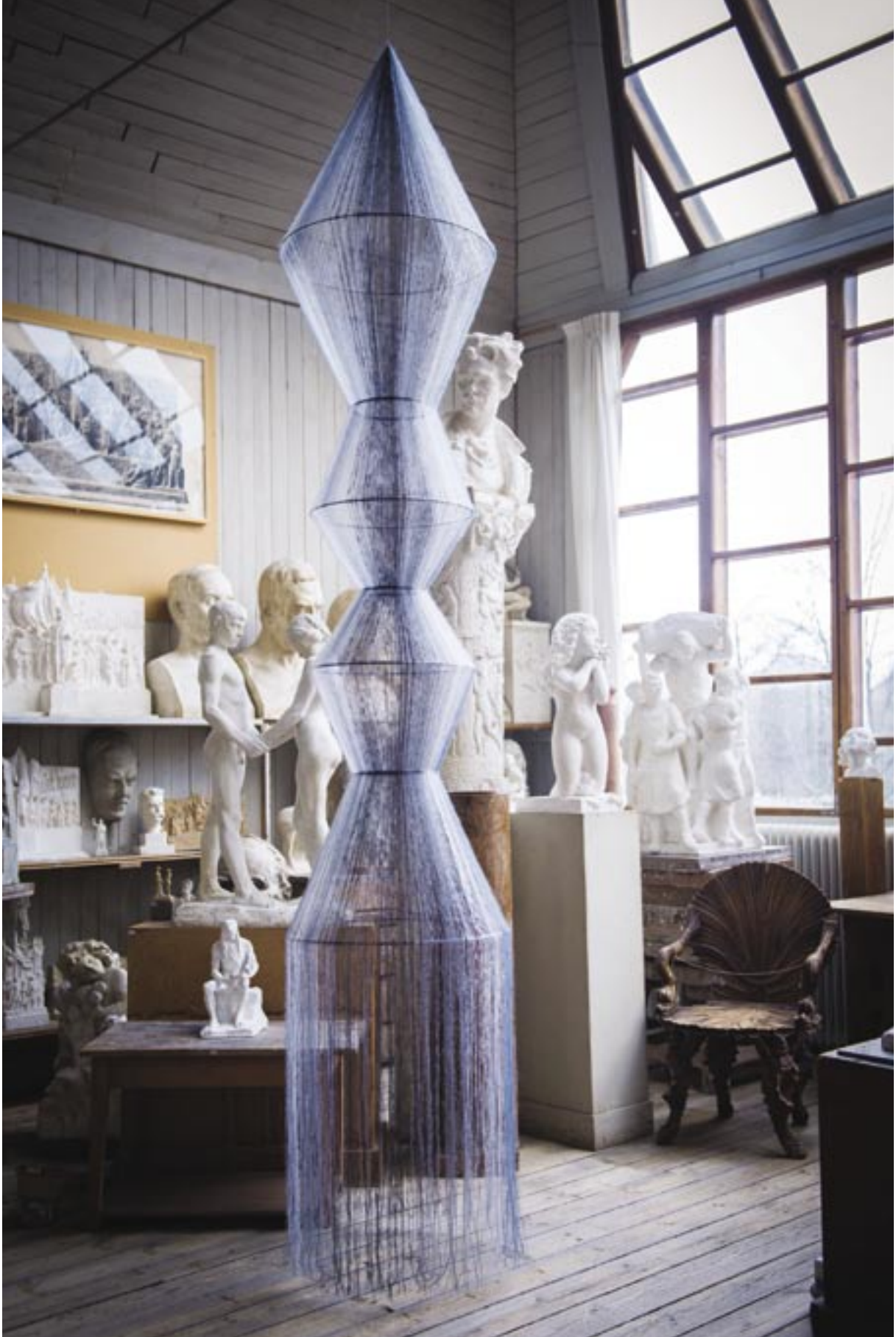
Black River Hologram, 2019