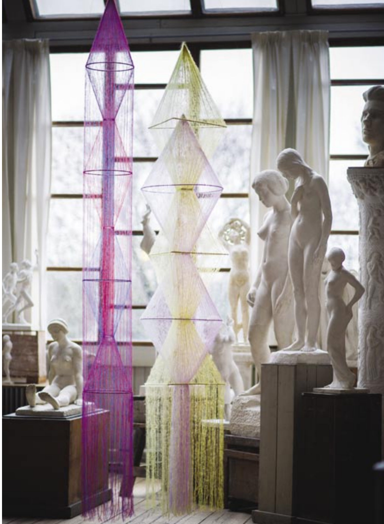
Impossible Floral Fountain, 2019