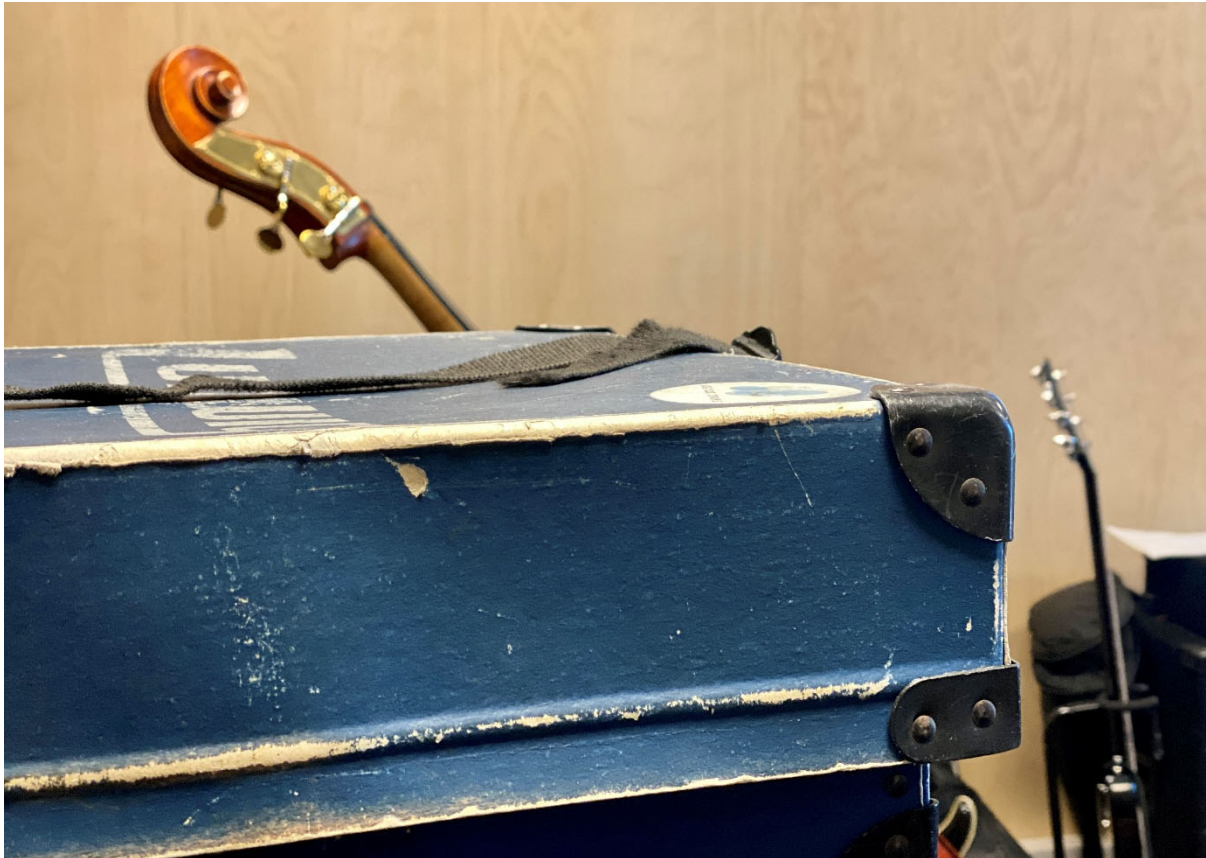
Fra stipendiat Vidars Schankes studio, Stavanger