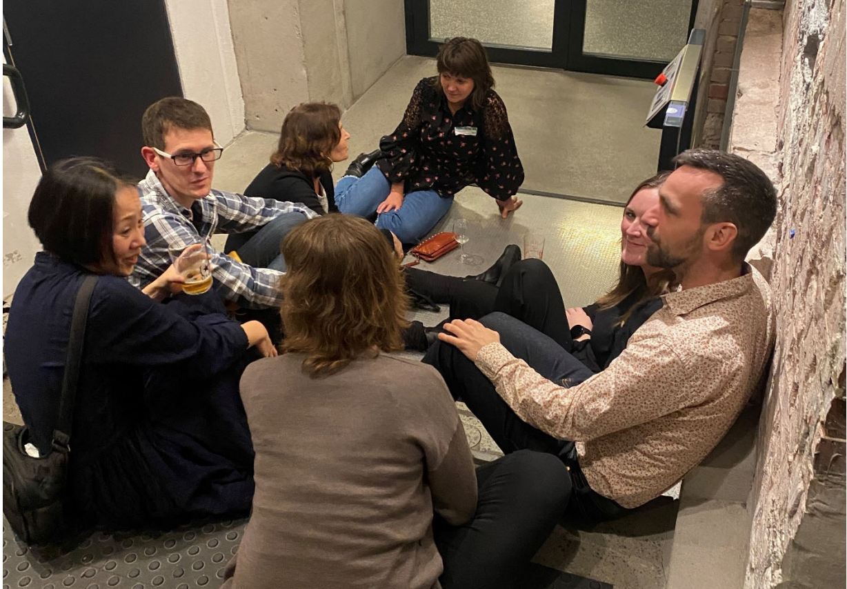
Nåværende og uteksaminerte stipendiater møtes på tvers av institusjoner og fagområder under Artistic Research Forum, Stavanger 2022.

UHR-KDA har satt ned en arbeidsgruppe for kunstnerisk utviklingsarbeid som erstatter tidligere Nasjonal råd for kunstnerisk utviklingsarbeid (NRKU). Denne arbeidsgruppen og andre spesialistgrupper har arbeidet med temaene omtalt ovenfor. Programstyret ser positivt på og anerkjenner viktigheten av at institusjonene forvalter dette ansvaret. PKU ivaretar sekretariatsfunksjon for arbeidsgruppen.